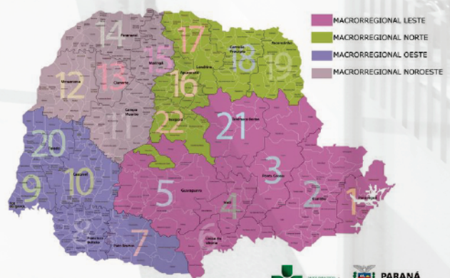
Mapa Político do Estado do Paraná - Divisão por Macrorregionais

POPULAÇÃO REFERENCIADA: Macrorregional Noroeste 115 municípios 1.845.881 habitantes (IBGE 2015).